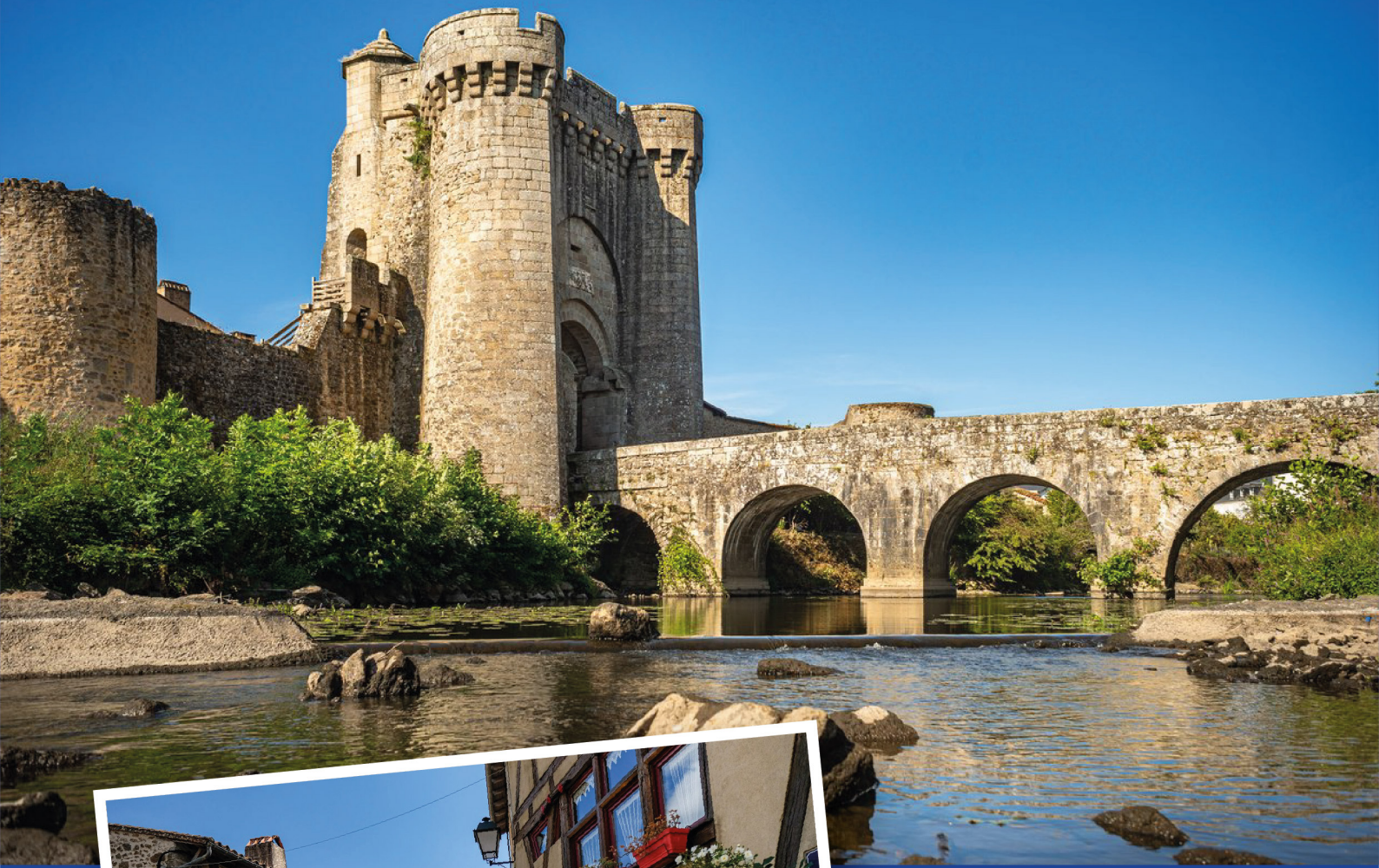
Rue de la Vau Saint-Jacques et sa porte